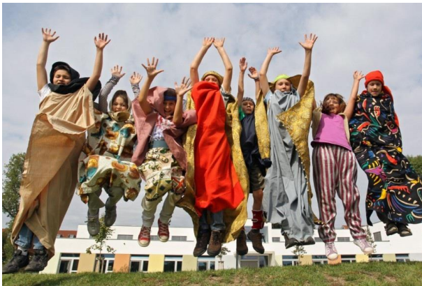
Tag der offenen Tür

Samstag, 21. November 2015 8:30 – 12:30 Uhr